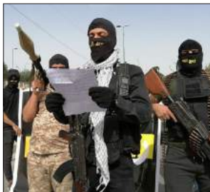
عیراق و هه ریم له نه گه ری نه رگورینی سوپای نه مه ریکادا 36-28...