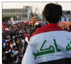
وانه نه فغانستانیبه کان له عیراق؛ نه گه ره کانی پاش رۆگورین یان کشانه وه ی 103-96... هیزه کانی نه مه ریکا