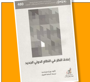
دوو باره بیرگردنه وه له شیرازه ی نوتی جیهانی 111-106...