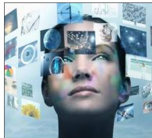
ناینده ناسی، پیشینی و به رنامه ریژی؛ 27-10.. نیچوون و جیاوازیبه کان