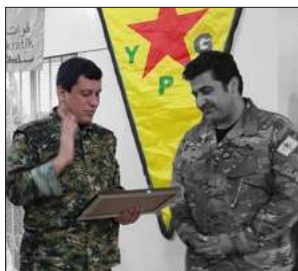
ناتنگارییه کانی به ردهم بایدن؛ نوتونومیی کوردی و فراوانخوازی 93-82... تورکی