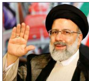
سه رده می ره نیسی و ناینده ی رۆژه لاتی کوردستان 61-52...