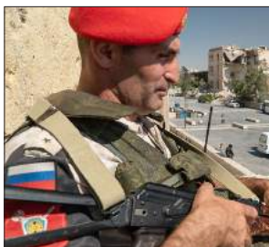
به رتوه بردنی رپوسیا بیانه ی قهیرانی سووریا و کاریگه ری له سهه رۆژئاوای 79-62... کوردستان