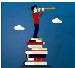
سیناریۆ ناینده بیبه کان 115-114...