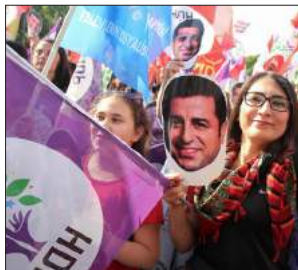
گرمو له سهه كوردانی دئشكاو گنجی كورد له تهرزوی هه لبراردنی 51-37... 2022-ی تورکیادا